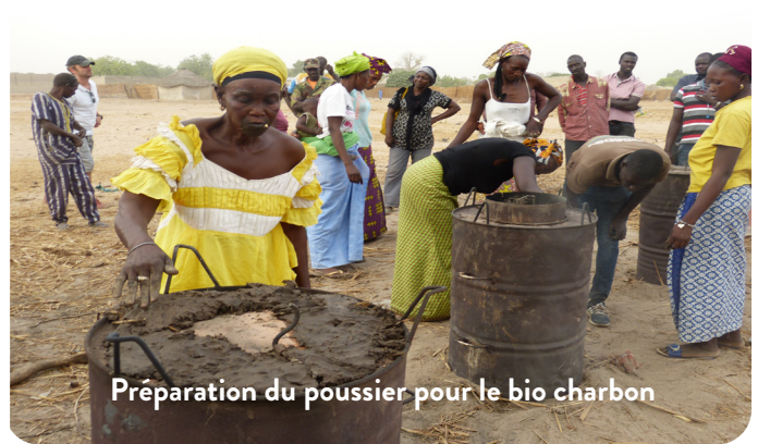
Préparation du poussier pour le bio charbon