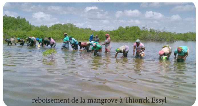
reboisement de la mangrove à Thionck Essyl