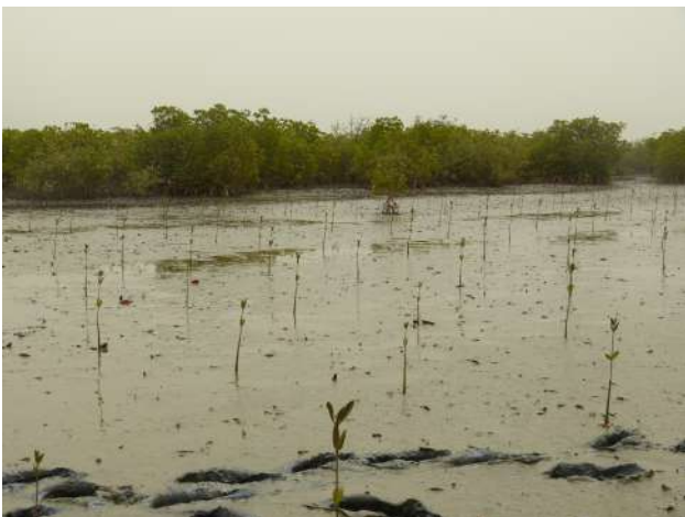
Figure 2: Visite des sites de reboisement