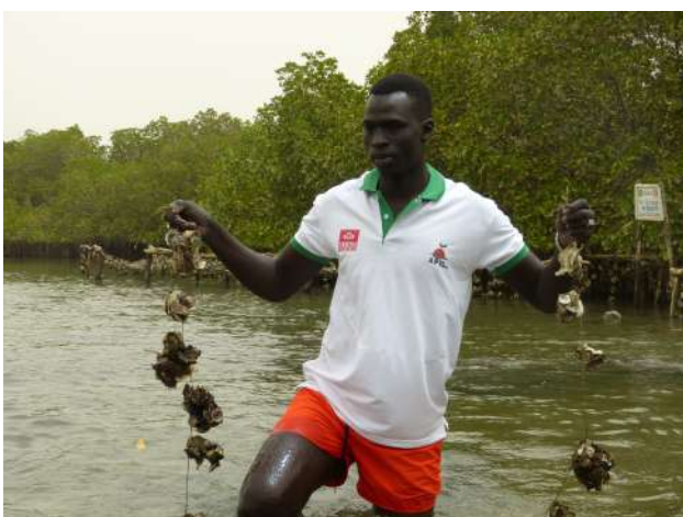
Figure 3 : Présentation des parcs ostréicoles