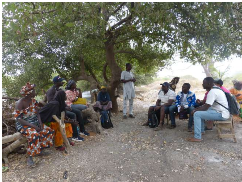
Figure 1 : Echanges entre les participants et le GIE des productrices d'huîtres

Les ONG TARUD et Kart travaillent ensemble dans la région de Kombo, sur la gestion de la mangrove du fleuve Gambie, frontière entre la Gambie et la Casamance. Depuis 2015, un projet accompagne les femmes des communautés sénégalaises et gambiennes bordant le fleuve, afin de développer des stratégies communes d'utilisation durable des ressources de la mangrove. Les participants ont ainsi rencontré un groupe de femmes, dans la culture écologique d'huîtres.