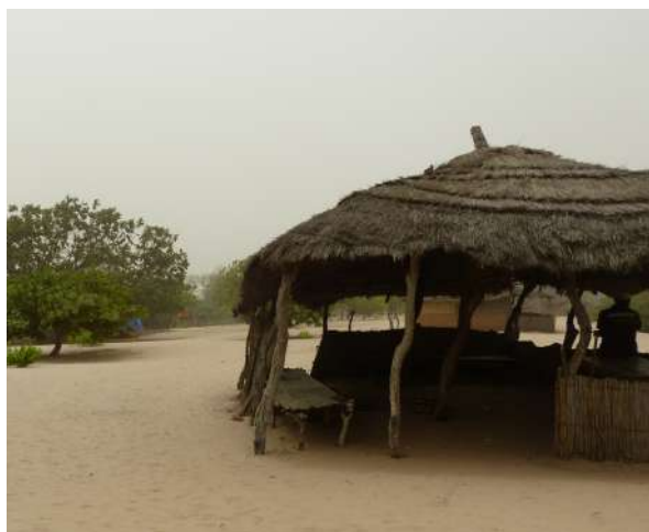
Figure 2 : Campement écotouristique

La visite a permis aux participant de découvrir un site où la mangrove a été préservée et n'est pas encore touchée.