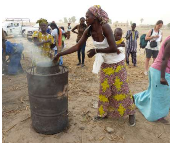
Figure 3: Transformation de charbon de paille