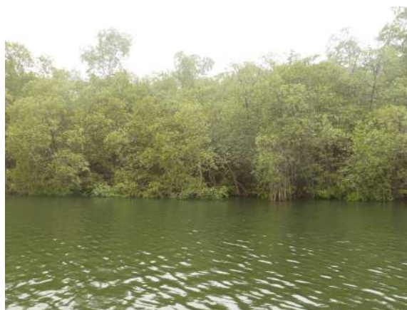
Figure 1 : Zones de mangroves préservées