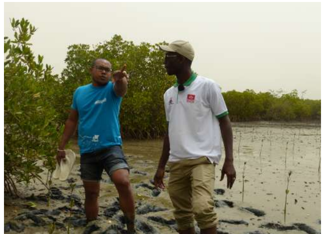
Figure 2 : Echanges entre les partenaires d'accueil et les participants sur les techniques de reboisement