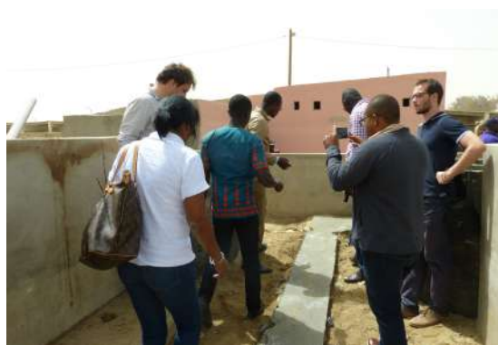
Figure 1 : Visite d'une unité de biogaz