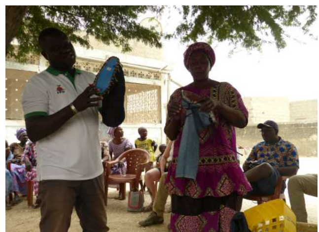
Figure 4 : Présentation des différents outils développés par APIL